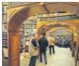
Oberlausitzische Bibliothek der Wissenschaften, derzeit Arndtstraße.