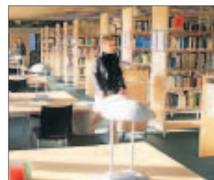
Bibliothek der Hochschule auf dem Campus Brückenstraße.