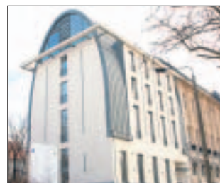
Stadtbibliothek auf der Jochmannstraße.

Görlitz ist reich an Bibliotheken. Die SZ zeigt, welche öffentlichen Büchereien es in der Neißestadt noch gibt: