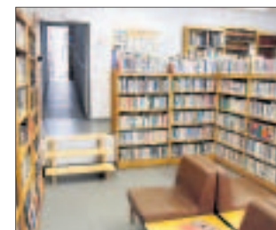
Die Europa-Bibliothek auf dem Untermarkt 23.