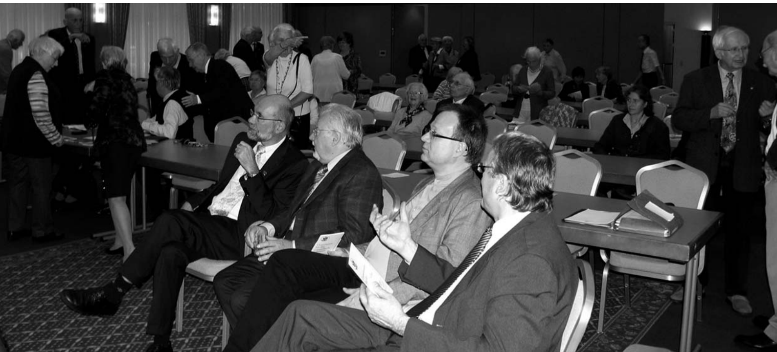
Blick in den Plenarsaal kurz vor Beginn des Festaktes am Sonnabendvormittag