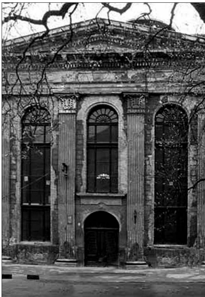
Die „Storchensynagoge“ um 1999