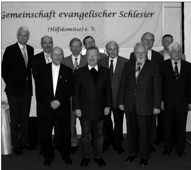
Gäste des Festaktes

So sah es auch unser Vorsitzender; das Ende der Gemeinschaft evg. Schlesier mag in Sichtweite sein, aber "die Stimmung ist besser als die Lage", und noch sind Aufgaben da: das, was wir unser "Erbe" nennen, benennen, bewahren und auch es getrost weiterzugeben und zu schauen, welche Inhalte in welchen Formen die nicht mehr in Schlesien Geborenen es aufnehmen und fruchtbar machen. Eigentlich rückt Schlesien uns ja (wieder) näher, die dort