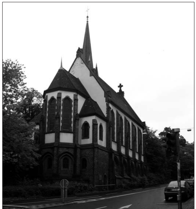
Kirche der Altkatholiken in Wiesbaden – hier fand der Festgottesdienst am 3. Oktober statt.

Und der Friede Gottes, der höher ist als alle Vernunft, bewahre eure Herzen und Sinne in Christus Jesus. Amen. <