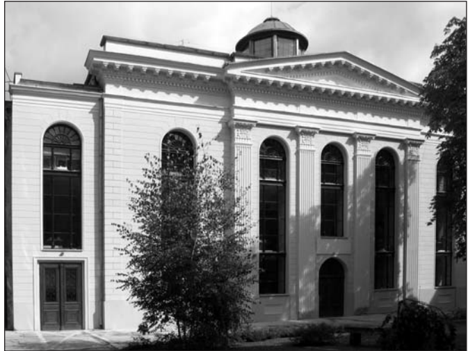
Die Storchensynagoge heute

häuser mit zerstört hätte. Die Synagoge entstand 1826-1829 und ist ein Werk des preußischen Architekten Carl Ferdinand Langhans. Bis zum Zweiten Weltkrieg war Breslau mit seinen etwa 30.000 Juden – mit zahlreichen bekannten Persönlichkeiten aus Kunst, Wissenschaft und Politik – eine der wichtigsten kulturellen Zentren des Judentums in Europa. Ein Besuch des jüdischen Friedhofs in Breslau, auf dem 12.000 Menschen ruhen, gibt einen Eindruck, wie groß, wohlhabend und bedeutend die jüdische Bevölkerung einst war.