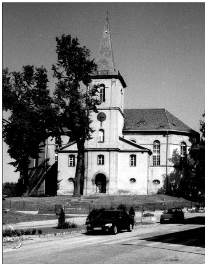
Ev. Kirche in Neumittelwalde