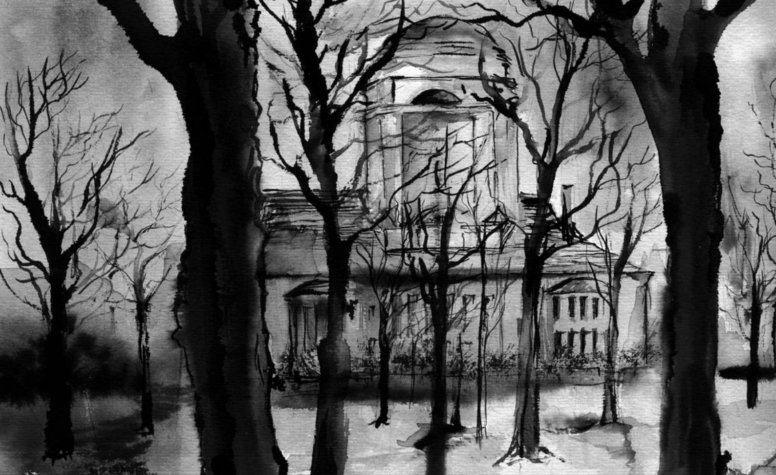
Neue Synagoge in Görlitz